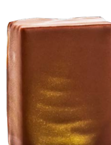
THÉ DE LA PAGODE (bleuets, citronnelle, goji, grenade)