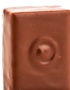
CITRONS VERTS DU BRÉSIL