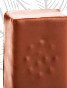
VANILLE DE MADAGASCAR