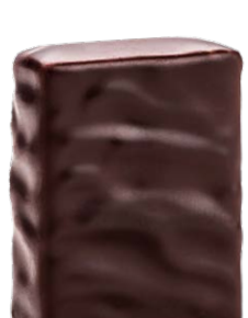
CASSIS NOIRS DE BOURGOGNE