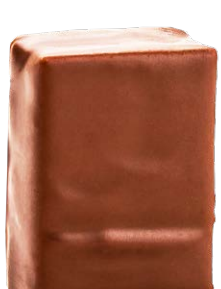
SEL NOIR D'HAWAÏ