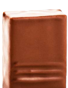
COCO DE CÔTE D'IVOIRE