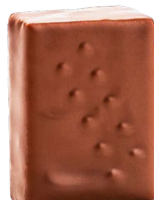
RÉPUBLIQUE DOMINICAINE 46%