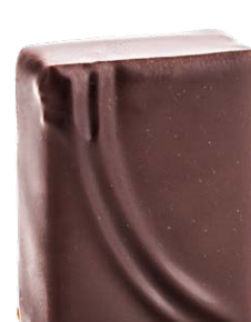
FRAMBOISES DE SERBIE