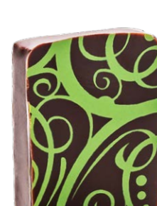
ANIS VERT DU LIBAN