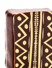
BHARAT DE TUNISIE