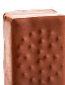
CARAMEL FLEUR DE SEL