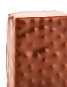
CANNELLE DE JAVA