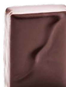
BLÉ MALTÉ GRILLÉ