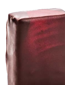
THÉ DE BROCÉLIANDE (sureau, mûre, framboise)