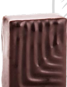
BLANC MANGER DES ANTILLES