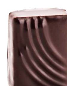
ORANGES DE SÉVILLE