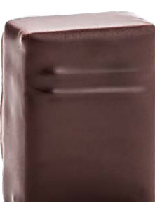
SARRASIN BRETON GRILLÉ