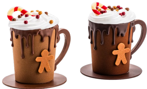
TASSE CHOCOLAT AU LAIT OU NOIR 26.90 €