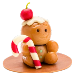
BONHOMME EN PÂTE D'AMANDES 10.90 €